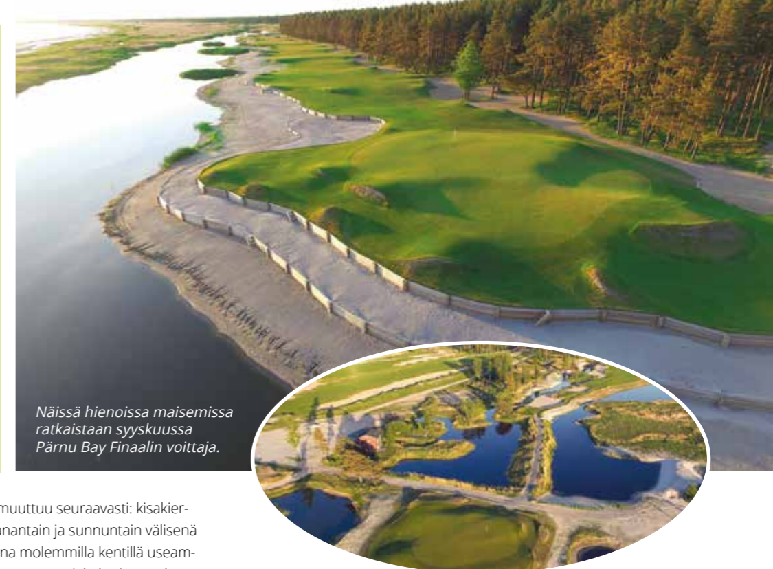
Näissä hienoissa maisemissa ratkaistaan syyskuussa Pärnu Bay Finaalin voittaja.

SHG:n viikkokilpailukonsepti muuttuu tulevalle pelikaudelle. Viikkokilpailuja pelataan edelleen seuran molemmilla kentillä: Lakistossa viikoilla 18-35 ja Luukissa viikoilla 22-35. Viikkokilpailun kisakierroksen voi pelata vapaasti maanantaista sunnuntaihin. Viikottaisista kilpailuista muodostuu uusi koko kauden kestävä kilpailusarja. Molempien kenttien kilpailusarjojen parhaat pelaajat pelaavat syyskuussa finaalkilpailussa Virossa Pärnu Bayssä kokonaiskilpailun voitosta.